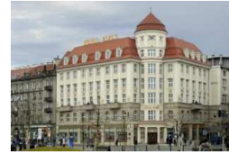
Hotel Piast Breslau

Telefon 06172-937966 Telefax 06172-8072760 JMG@SL-Hessen.de