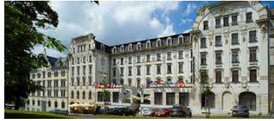
Hotel Zlatý Lev Reichenberg