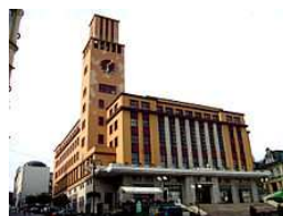
Gablonz a.d.Neiße (Jablonec n.N.)